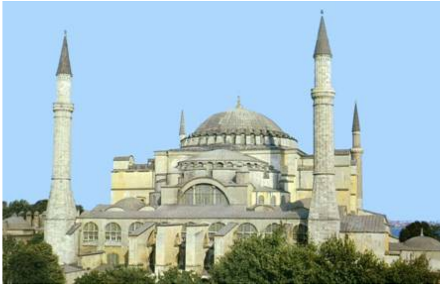
cathédrale de ste-sophie de constantinople

L'art byzantin s'est développé dans l'Empire byzantin entre la disparition de l'Empire romain d'Occident en _____, et la chute de Constantinople en _____. L'art produit auparavant dans la même région est confondu avec l'art paléochrétien.