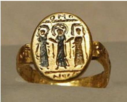
Bague de mariage, VII e siècle, or et nielle.