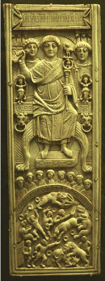
Feuille d'un diptyque en ivoire de Areobindus, consul à Constantinople, 506.

Areobindus, en haut, préside les jeux à l'Hippodrome, en dessous.